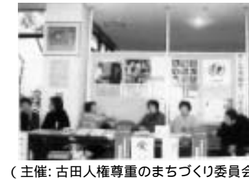
(主催: 古田人権尊重のまちづくり委員会・二人人権のまちづくり会・播磨町青年協会・文化クラブ21はりま準備会、後援: 播磨町・播磨町教育委員会)