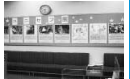
~学校は夢に近づく一歩、学ぶ権利を未来ある子ども達に叶えてあげたい~ (ご覧いただいた方の感想より)