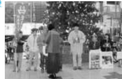
~寒い中、世界の同年代の子ども達の厳しい現状に心を寄せて、大声で募金を呼びかけてくれた皆さん、どうもありがとうございました~