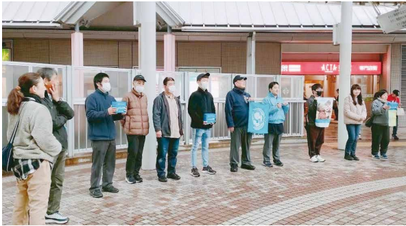
81人が参加し20万円を超える多額の募金をお預かりしました。ありがとうございました。

日時/場所 11月14日(金)/住吉(神戸) 12月21日(土)/姫路、明石、元町(神戸)、住吉、西宮(2か所)