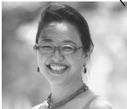
2019年1月14日(月・祝) 兵庫県民会館