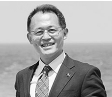
2019年2月23日(土) 神戸栄光教会