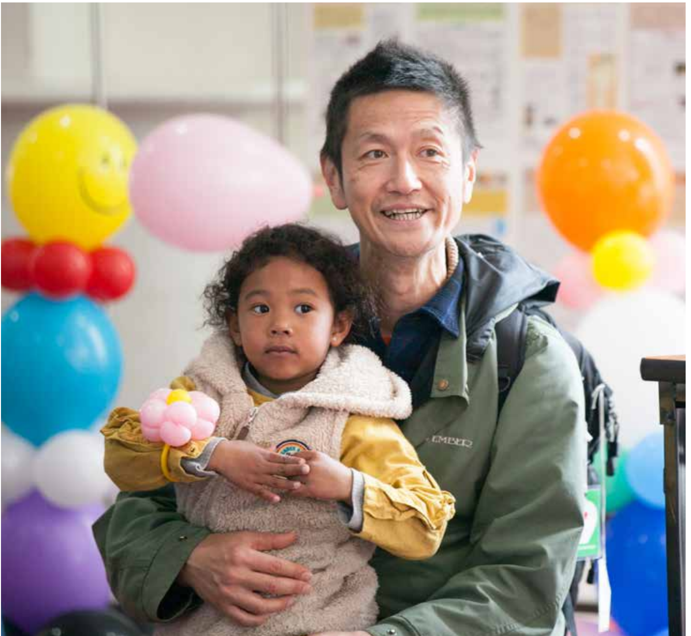
ユニセフのつどい