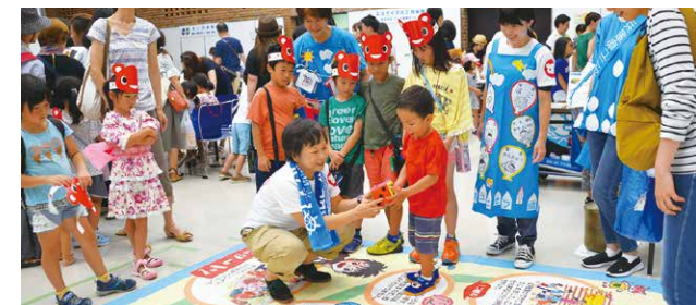
上 子どもの権利条約を熱心に学ぶ参加者 中左 小学校での出前講座 中右 緊急募金の呼びかけ 下 ケニアのケベラスラムより青年を迎えての国際理解講座